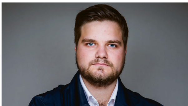
Stortingsrepresentant: Tobias Drevland Lund.

– Samtidig som det stedlige tilbudet forblir lagt ned, viser forskning at den samiske befolkningen er mer utsatt enn den øvrige for vold og overgrep. Vi vet generelt om vold og overgrep at langt ifra alle tilfeller ser dagens lys i form av at myndigheter