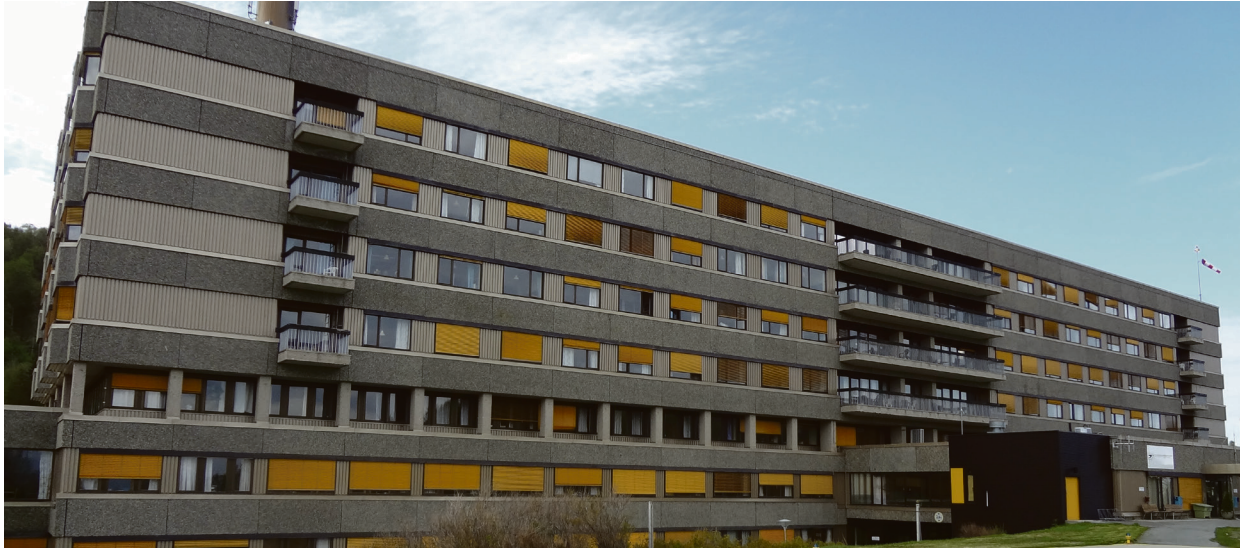
Avslutter samarbeidet om overgrepsmottak: Nordlandssykehuset avslutter samarbeidet med UNN i Harstad (på bildet) om et overgrepsmottak i Harstad.