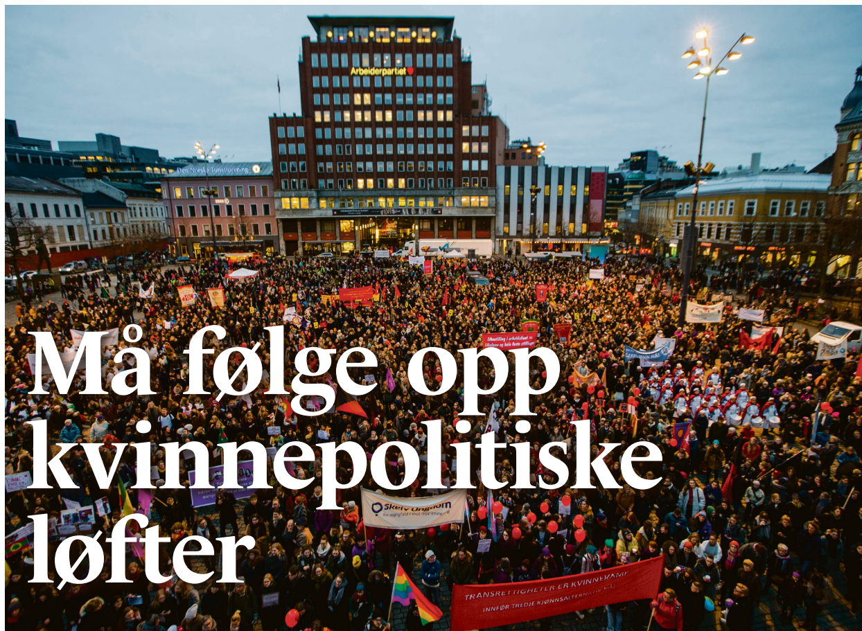
Utålmodig: Kvinnebevegelsen har fått gjennomslag for viktige krav i regjeringsplattformen, men Rødt etterlyser større framdrift.

Når vi kjemper for et mer rettferdig samfunn, spiller den organiserte og kollektive kvinnekampen en uvurderlig rolle. For som det står i sangen «På veg»: For halve men'skeheta kan aldri sjøl bli fri når resten av den tvinges til et liv i slaveri!